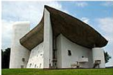
Notre Dame du Haut