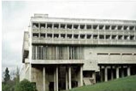
Ste Marie de la Tourette