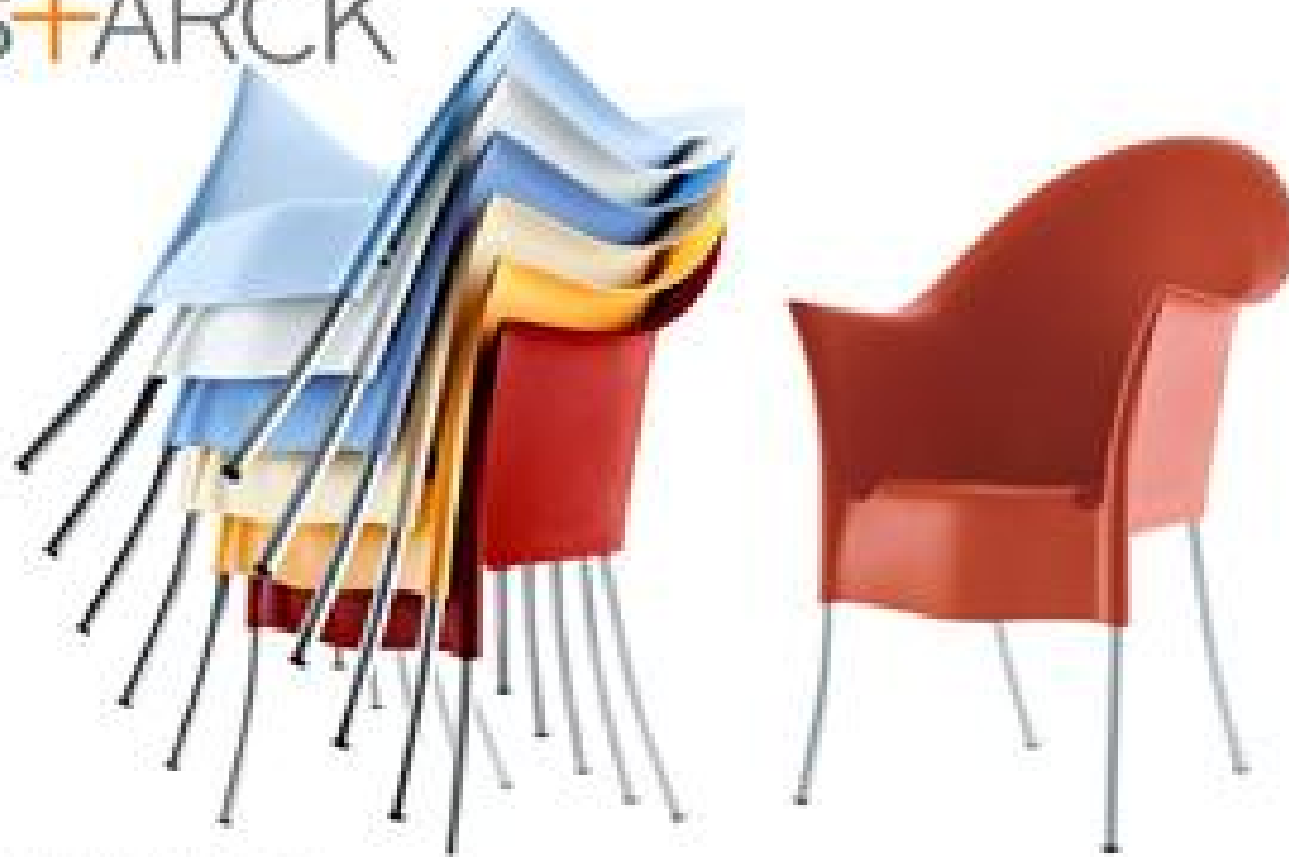
Red Lord Yo, Driade 2006