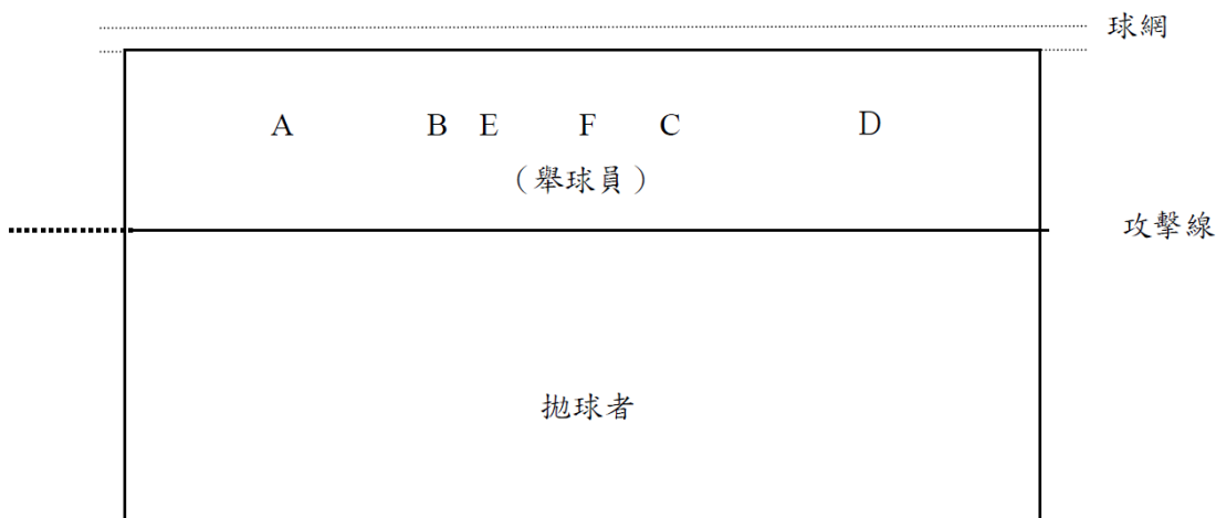
圖二 排球攻擊手快攻位置示意圖

(2) 若有報考舉球員或自由球員之考生，則進行主、輔攻擊手及快攻手測驗時，擔任舉球員及後排防守球員之角色進行測驗，並依照表 12 舉球員、自由球員參照標準，作為技術評分之依據。